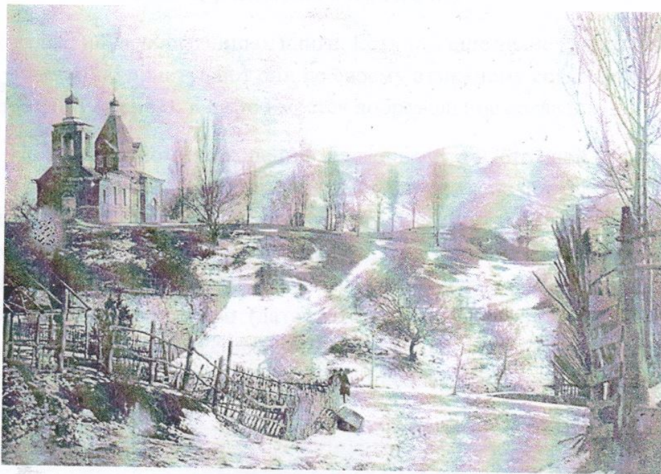
Крестовоздвиженский храм в посаде Туапсе. Фото 1897 года. Сейчас это – центральная часть города.

Уникальную информацию дают нам церковные метрические книги. Недавно мне повезло – удалось полистать метрические книги Крестовоздвиженской церкви Туапсе. Это – один из старейших соборов Туапсинского округа Черноморской губернии. Самая старая фотография церкви относится к 1897 году, и сделал ее окружной врач С. М. Богословский.